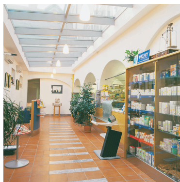
LEKARNA - KRANJ