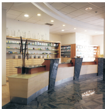
LEKARNA MURSKA SOBOTA